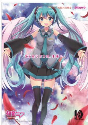
illustration by みなみさき © Crypton Future Media, INC. www.piapro.net piapro